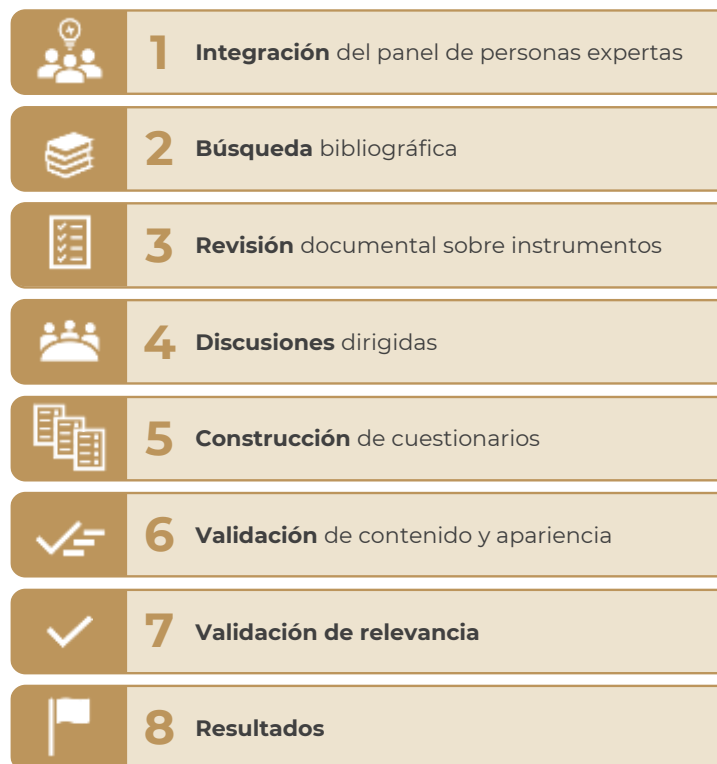
Figura 1: Etapas de validación del CAPIA

Se describe la secuencia de actividades que se llevaron a cabo para desarrollar y validar el cuestionario.